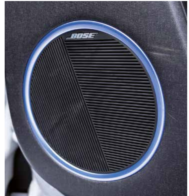
Système audio premium Bose®.