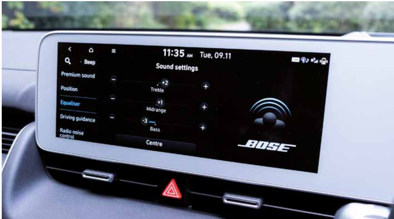
Système multimédia avec écran couleur tactile 12,3" avec reconnaissance vocale.

Apple CarPlay™ est une marque d'Apple Inc. Android Auto™ est une marque de Google Inc.